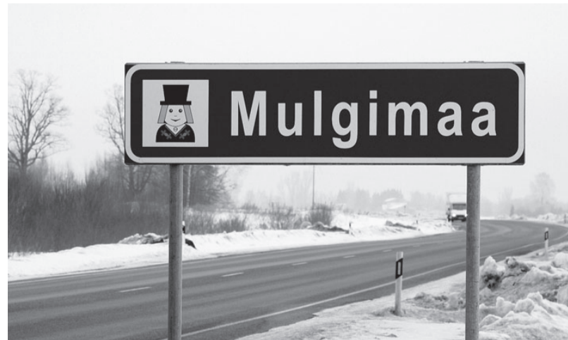
Mulgimaa kultuuriprogramm ootab projektitaotlusi.

Mulgimaa programm hõlmab Viljandimaal Abja, Halliste, Karksi,